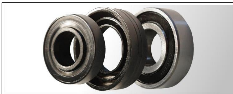
Uszczelnienie labiryntowe dwuelementowe ST (UL-6204) wraz z łożyskiem 2RS 6204: (od lewej): PIERŚCIEŃ WEWNĘTRZNY, PIERŚCIEŃ ZEWNĘTRZNY